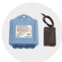
Akumulátor Li-Ion 8 Ah pre vysielač, nabíjač 230 V