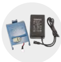
Akumulátor Li-Ion pre prijímač, nabíjač 230 V