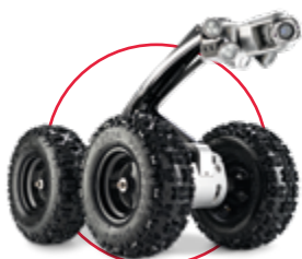
Kamerový vozík [DN450 – DN2000] RX400