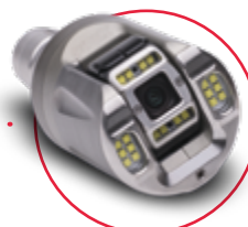
Otočná kamera [DN100 – DN300] PTC50