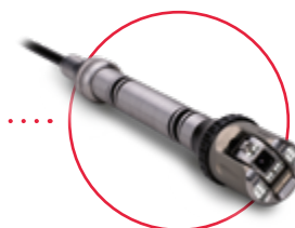
Otočná kamera [DN56 – DN300] PTP50