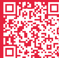
VIDEOUKÁŽKA PRÁCA SO SW WINCAN