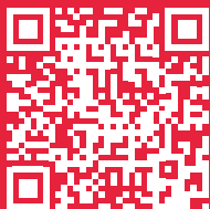
VIDEOUKÁŽKA MANIPULÁCIA S VOZÍKOM