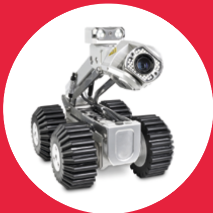
VOZÍK S KAMEROU Rovion® RX130 s 3 nápravami