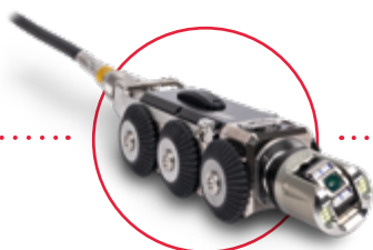
Kamerový vozík [DN100 – DN200] RX95