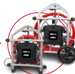
Tlačný kamerový systém