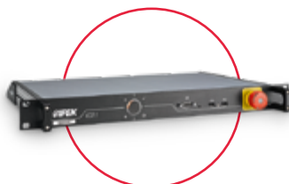
Vyhodnocovacia jednotka pre káblový navijak & SAT až do 300 m