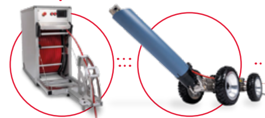
SAT káblový navijak až do 300 m + 34 m SAT kamerový vozík (DN150 – DN200)