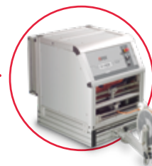
Automatický káblový navijak až do 500 m