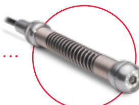
Axiálna kamera [DN44 – DN200] AC40