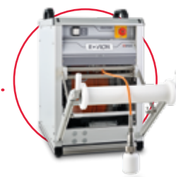
Automatický káblový navijak až do 300 m