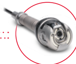
Otočná kamera [DN79 – DN300] PTP70II