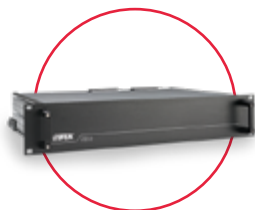
Vyhodnocovacia jednotka pre káblový navijak & SAT až do 500 m