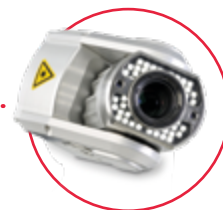
Otočná zoom kamera [DN146 mm – DN2000] RCX90