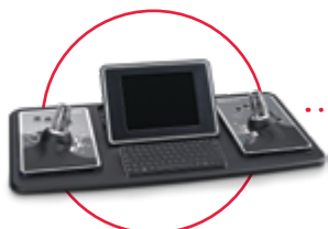
Ovládací panel do kamerového vozidla