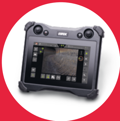
VISIONCONTROL 500 Dotyková i tlačidlová jednotka