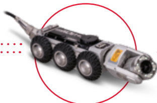
Kamerový vozík [DN150 – DN300] Možnosť až do DN1000 RX130