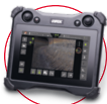
Mobilný ovládací panel